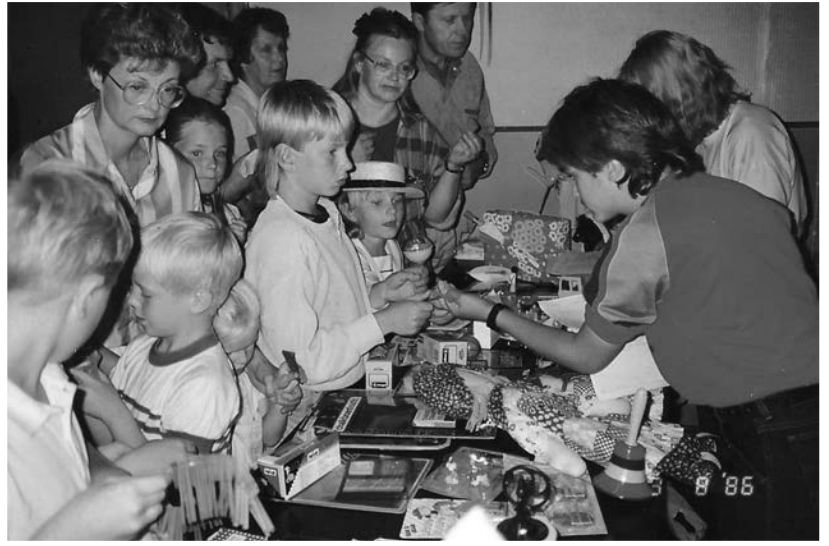
1986 yhdistyksen 10-vuotisjubilissa lasten arpajaisien voittojen lunastuksessa kävi viloke. Löydätkö tuttuja?

3.2.1978 Länsi-Suomen Vesioikeus antoi myönteisen päätöksensä Nurmijärven kunnan pumppaamohankkeessa. Koska päätös oli ranta-alueiden omistajien kannalta monessa suhteessa epätydyttävä, yhdistys teki korkeimmalle hallinto-oikeudelle päätöksestä valituksen, johon lähes 80 allekirjoittajaa antoi valtakirjaansa. KHO:n päätös lokakuussa 1978 jätti voimaan vesioikeuden pää-