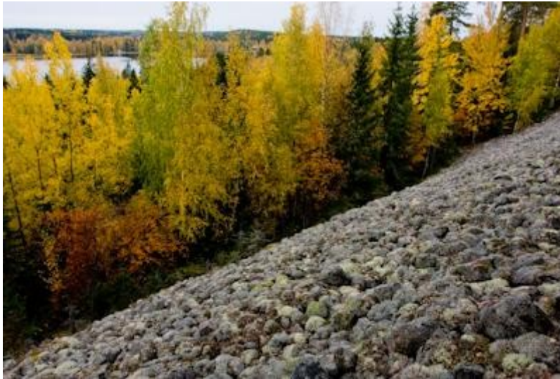
Ylimmäisenjärven muinaisranta.

Jääkauden jälkeinen Baltian jääjärvi peitti Vihtijärven aluetta noin 11 000 vuotta sitten. Vain Rokokallion huippu oli vedenpinnan yläpuolella. Yoldiamerivaiheen alkaessa 10 200 vuotta sitten alue paljastui suurimmaksi osaksi, eikä vesi enää peittänyt sitä. Ensimmäiset ihmiset alueelle saapuivat 9 000 vuotta sitten. Merkit ensimmäisestä vakituisesta asutuksesta ajoittuvat kuitenkin vasta ajalle 2500 – 1500 eAa. Kiinteän asutuksen Vihti sai keskiajalla. Vihtijärven neljännekunnan muodostivat myöhäiskeskiajalla neljä kylää: Vanhakylä, Niemi, Veirlä ja Hiiskula. 1500-luvun loppuun mennessä kylien taloluku oli noussut 11 taloon.