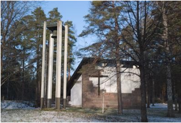
Vihtijärven kappeli valmistui 1961.