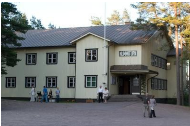
Nummitupa on valmistunut vuonna 1954.

Hiiskulan mailla ovat uimaranta, Rokoladun pohja ja Rokokota sekä pururata Nummituvan ympäristössä.