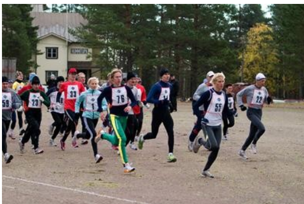
Ensimmäinen Vihtijärvi-hölkä juostiin 1969.